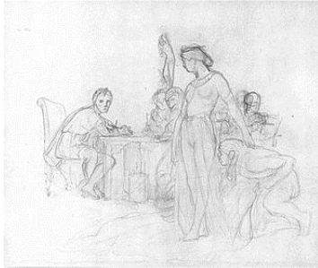
Jean-Léon Gérôme, Cléopâtre et César , esquisse, crayon sur papier, collection Gerald Ackerman

reste comme cloué à son siège. Notre esquisse à l'huile montre Cléopâtre également debout, et César restant immobile, dans la même position que dans le dessin. Tandis que dans le tableau final, César, toujours assis mais d'une attitude plus tonique, trace un mouvement de stupéfaction de sa main gauche.