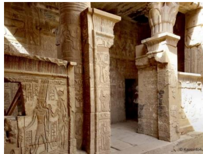
Vue actuelle du petit temple dédié à Hathor à Deir el-Medineh (ou Deir al-Médina).