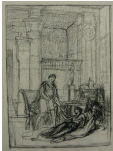
Jean-Léon Gérôme, Cléopâtre et César , esquisse, mine de plomb et fusain sur papier, H. 175 mm ; L. 130 mm, Vesoul, musée Georges Garret

L'œuvre a été commandée par la marquise de Païva, l'une des plus fameuses courtisanes de l'époque, pour la demeure luxueuse qu'elle venait de construire sur les Champs-Élysées. Finalement refusé à la livraison, le tableau est par la suite acheté par Adolphe Goupil, le beau-père de l'artiste.