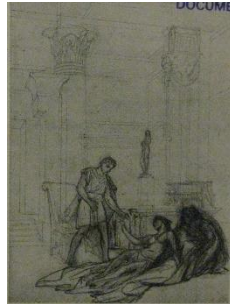
Jean-Léon Gérôme, Cléopâtre et César , esquisse, mine de plomb, plume et encre de chine sur papier, H. 305 mm ; L. 225 mm, localisation actuelle inconnue (galerie Paul Prouté en 1987)