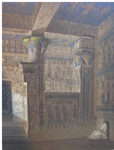
Description de l'Egypte ou recueil des observations et des recherches qui ont été faites en Egypte pendant l'expédition de l'Armée française publié sous les ordres de Napoléon Bonaparte , 1809-1822, vol. II, planche 37.

Le fond architectural est une copie fidèle d'une planche coloriée de la Description de l'Egypte montrant le petit temple de Deir el Medineh. Dans le tableau final, ce fond se trouve inversé, ce qui permet de donner une réplique formelle à la figure de Cléopâtre par la colonne derrière. Les costumes des figures, surtout la jupe fendue de Cléopâtre et la coiffure d'Apollodore (à mi-chemin entre le némès pharaonique et le voile des bédouins) sont fruit de la fantaisie de l'artiste et reflètent une Egypte imaginaire.