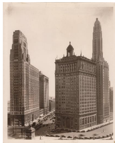
Fig. 2 Kaufman & Fabry, Chicago , tirage argentique d'époque 1928. D. R.