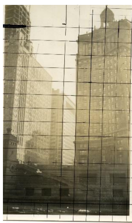
Fig. 4 Bernard Boutet de Monvel, Paysage de Chicago -London Garantie building , tirage argentique d'époque mis au carreau, 1928.