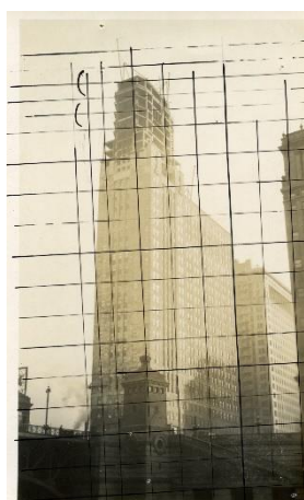
Fig. 3 Bernard Boutet de Monvel, Paysage de Chicago - Michigan building en construction , tirage argentique d'époque mis au carreau, 1928. Coll. Stéphane-Jacques Addade